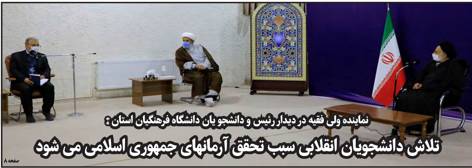
نماینده ولی فقیه در دیدار رئیس و دانشجویان دانشگاه فرهنگیان استان