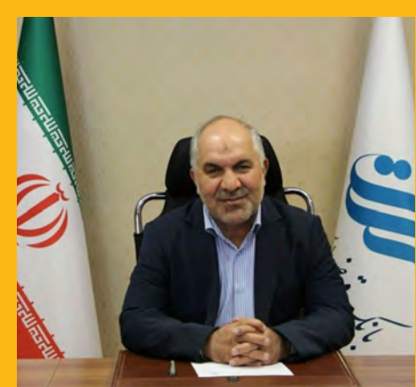
مدیرعامل بانک قرض الحسنه رسالت: