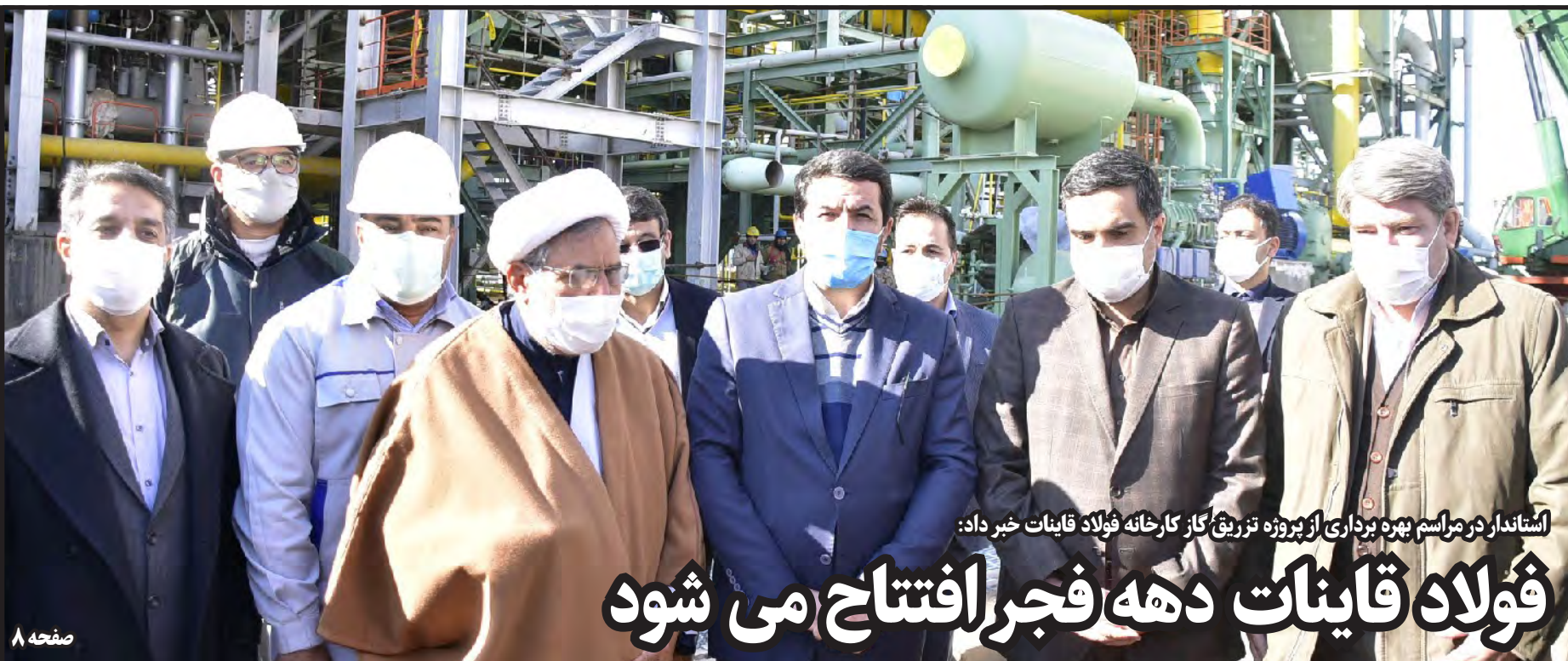
استاندار در مراسم بهره برداری از پروژه تزریق گاز کارخانه فولاد قاینات خبر داد: