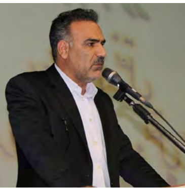
فضای سبز تهیه می شود تا شاهد توفیقات بیشتری در این زمینه باشیم.

مدیریت ارتباطات و امور بین الملل شهرداری