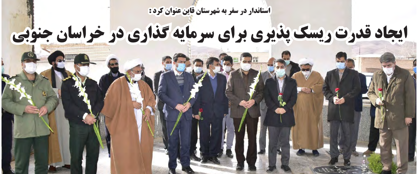
استاندار در سفر به شهرستان قاین عنوان کرد: ایجاد قدرت ریسک پذیری برای سرمایه گذاری در خراسان جنوبی

با این بودجه ها حتی نمی توان حقوق پرسنل را در طول سال به دستشان رساند چه رسد به تهیه ابزار آلات به روز و پیشرفته ، بطور مثال برای خاموش کردن جنگلهایی که در آتش می سوزند حتی یک یالگره که توان حمل تانکرهای آب برای خاموش کردن شعله های آتش در اختیار ستاد بحران کشور نیست و این مردم محلی هستند که خودشان با کمترین آموزش مسئولیت ستادهای بحران را به دوش می کشند ، در زمینه سیل و زلزله نیز همواره مردم بجای ستاد انجام وظیفه کرده اند ، ستاد بحران یعنی در طلایی ترین لحظاتی که انسانها به کمک و نجات نیاز دارند حاضر شود و کارایی خویش را در عمل به اثبات رساند نه اینکه پس از گذر از ساعتها و روزها صلانه صلانه سر و کله اش پیدا شود!!!! بودجه صدا و سیما در سال ۱۴۰۰ ، یکمصد و نود و یک برابر ستاد بحران کشور است ، فقط نمونه ای آوردیم تا بدانیم که اصولا در زمینه علم بودجه ریزی همانگونه که در مطلب بالا ذکر کردیم کم سواد و بی سوادیم و حتما سازمان برنامه و بودجه و نمایندگان مجلس بسیار و بسیار بیشتر از ما می فهمند!!!!