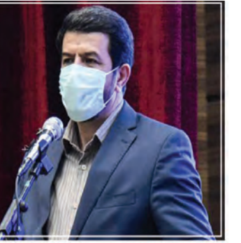
تقویت حوزه بهداشت و درمان استان ضروری است

وزیر بهداشت بیان کرد: طی دو ماه علاوه بر واردات، تولید داخل را هم داشتیم، برای واکسن هم بیکار ننشسته ایم و خیلی ها را هم چراغ خاموش می روییم چون با دنیایی طرف هستیم که حقوق مسلم ما را می خواهند از ما سلب کنند. وی تصریح کرد: برای جابه جایی یک دستگاه یا آنتی ژن، گمرک های ما را قفل می کنند و من به عنوان وزیر بهداشت نمی توانم به خاطر اینکه برای من دست بزنند مسائل را نابود نخورند. وی گفت: داروهایی مانند رمدا سیور مربوط به کرونا را تا یک روز یا دو روز بعد از آن که توسط سازمان بهداشت جهانی یا آمریکا و سایر اعلام می شد، در ایران داشته ایم.