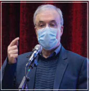
ظلم به ملت ایران به واسطه تحریم ها بی سابقه است