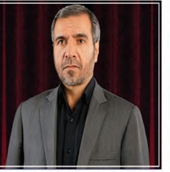
۱۲ درخواست مردم خراسان جنوبی تقدیم وزیر بهداشت شد