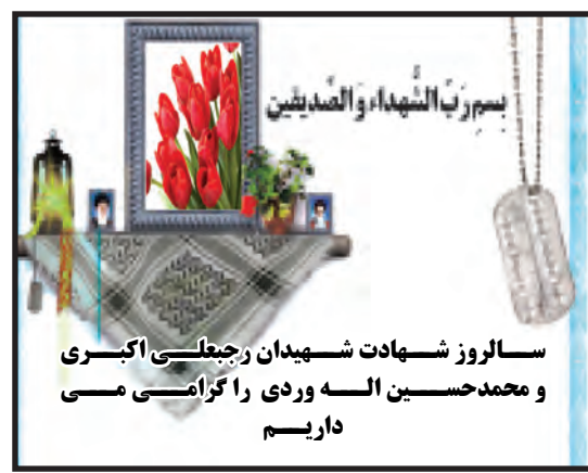
سالروز شهادت شهیدان رجایی اکبری و محمدحسین اله وردی را گرامی می داریم