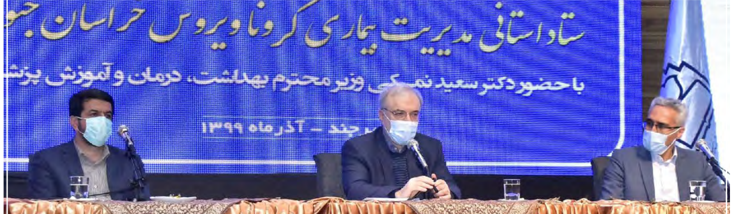
حضور دکتر سعید نمکی وزیر محترم بهداشت، درمان و آموزش پزشکی در جلسه مدیریت استانی بیماری کرونا و ویروس خراسان جنوبی

آموزش خراسان جنوبی... گروه خبر دکتر نمکی وزیر بهداشت از مهار موج سوم کرونا در استان خبر داد و گفت: خوشبختانه به لطف خداوند و همگرایی و هم فکری که بین همه نیرو های نظام اتفاق افتاد و همراهی مردم شریف استان، خوشبختانه امروز می توانیم بگوییم که موج سوم سهمگین کرونا را مهار کردیم.