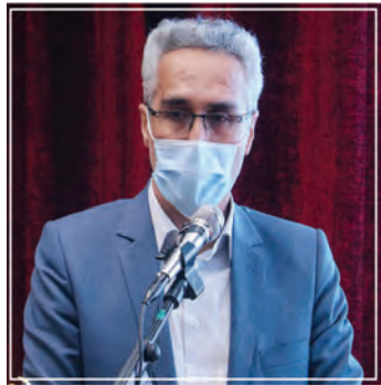
تخت های بیمارستانی خراسان جنوبی به هزار و ۲۰۰ تخت افزایش یافت

آمده ام برای مردم کار کنم وزیر بهداشت بیان کرد: طی دو ماه علاوه بر واردات، تولید داخل را هم داشتیم، برای واکسن هم بیکار ننشسته ایم و خیلی ها را هم چراغ خاموش می روییم چون با دنیایی طرف هستیم که حقوق مسلم ما را می خواهند از ما سلب کنند. وی تصریح کرد: برای جابه جایی یک دستگاه یا آنتی ژن، گمرک های ما را قفل می کنند و من به عنوان وزیر بهداشت نمی توانم به خاطر اینکه برای من دست بزنند مسائل را نابود نخورند. وی گفت: داروهایی مانند رمدا سیور مربوط به کرونا را تا یک روز یا دو روز بعد از آن که توسط سازمان بهداشت جهانی یا آمریکا و سایر اعلام می شد، در ایران داشته ایم.