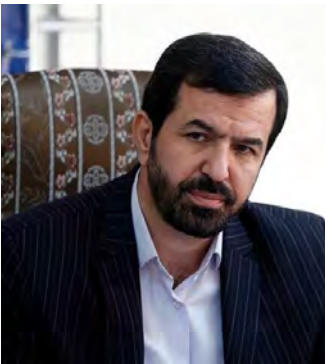
کشور تأکید کرد: هنر ما در شورای عالی این است که به سودآوری پروژه ها فکر کرده و برای تحقق آن، برنامه ریزی کنیم.

لحاظ گردد، گفت: برای اجرای پروژه ها، بازه زمانی تعریف و برنامه ریزی و هماهنگی های لازم با سایر دستگاههای مرتبط انجام شود تا کارهای عملیاتی با شتاب پیش برود و معطل نماند. استاندار خراسان جنوبی به پروژه های مشارکتی هلال در سطح کشور نیز اشاره کرد و اظهار داشت: در این پروژه ها، سهم بیشتر باید برای هلال احمر در نظر گرفته شود. ملا نوری خاطر نشان کرد: با عنایت به این که عموم مردم از منافع هلال احمر بهره مند می شوند لذا هر چه درآمد های این مجموعه از پروژه ها بیشتر باشد، سطح خدمات دهی نیز ارتقاء خواهد یافت. عضو شورای عالی جمعیت هلال احمر