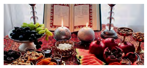
سیمیه حسن شاهی