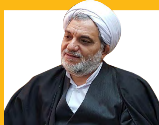
رئیس کل دادگستری تأکید کرد: تشدید نظارت‌ها بر بازار صفحه ۳