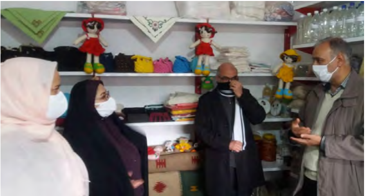
این راستا نیازمند مرکزی حمایتی هستند تا آنها را به بازار فروش متصل کند. طالبی بیان داشت: فروشگاه اینترنتی تولیدات خانگی «ساروق» با حمایت موسسه خیریه

توانمندساز حضرت رسول (ص) و امور بانوان و خانواده خراسان جنوبی در این راستا ایجاد شده است. وی افزود: این کارگاه تاکنون هفت نفر از بانوان را آموزش داده که در خانه مشغول به کار هستند، همچنین ۲۰ نفر از بانوان آموزش دیده تا ۱۰ دیماه وارد بازار کار میشوند. مسئول کارگاه توانمندسازی بانوان خراسان جنوبی ادامه داد: همچنین هشت نفر دیگر نیز از ابتدای دی ماه برای آموزش مراجعه می کنند.