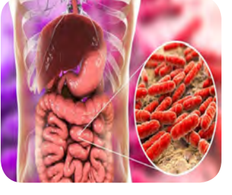
طولانی، می تواند از غشای محافظتی خود خارج شده و شروع به گسترش بیشتر کند.

دلیل آنکه موجب تب و افزایش دمای بدن می شود، ممکن است سلول های خفته سرطانی را فعال کند. به گزارش روسیا الیوم، پروفیسور آنچا پارانووا از دانشکده زیست شناسی سیستماتیک در دانشگاه جورج میسون اظهار کرد: علائم ویروس کرونا، به دلیل التهاب طولانی مدت در برخی موارد، می تواند سرطان را بیدار کند. او بیان کرد: نوموری که خفته بوده و رشدی ندارد، به دلیل دمای بالای بدن برای مدت