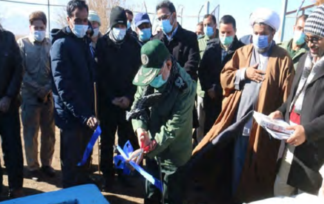
مجمع آبرسانی که روستای میغان از آن تغذیه می شود از جمله بزرگترین مجتمع های شهرستان است که ۱۵ روستا شامل ۹۰۰ مشترک را پوشش می دهد اما