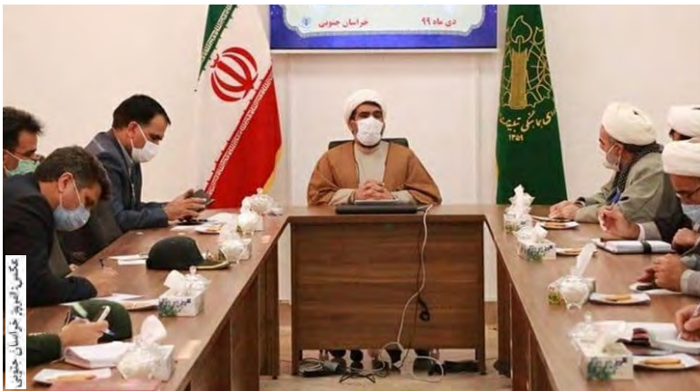
رئیس شورای هماهنگی تبلیغات اسلامی خراسان جنوبی از برگزاری مراسم یوم... ۹ دی به صورت مجازی در سراسر استان خبر داد.