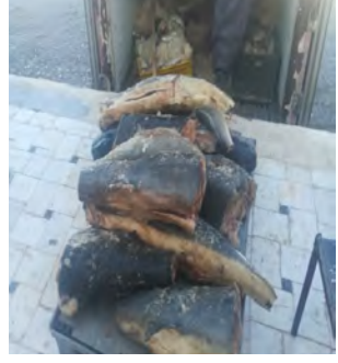
کشف ۱۰۰ میلیون ریال کالای قاچاق در "طبسی"

مشکوک و با علائم هشدار دهنده به راننده خودرو دستور ایست داده که راننده سواری پژو با مشاهده مأموران بر سرعت خودرو افزود و متواری شد. فرمانده انتظامی خراسان جنوبی در ادامه گفت: مأموران خودروی حامل مواد مخدر را تعقیب و با اقدامات پلیسی و شلیک چندین تیر با رعایت قانون بکارگیری سلاح آن را متوقف، که در بازرسی از خودرو ۳۴۰ کیلو و ۱۵۰ گرم تریاک و ۳۷۹ گرم حشیش کشف شد. این مقام ارشد انتظامی با بیان اینکه مأموران در این رابطه یک متهم دستگیر کردند و متهم دستگیر شده به همراه پرونده به مراجع قضائی معرفی و روانه زندان شد؛ تصریح کرد: پلیس در راستای برقراری نظم و امنیت و آرامش عمومی برای هموطنان عزیز در تمامی ساعات شبانه روز از هیچ تلاشی فروگذار نخواهد کرد.