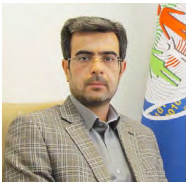
مدیر کل ثبت احوال خراسان جنوبی

کاهش ۴/۳ درصدی آمار ولادت در سال جاری / وی آمار ولادت ثبت شده در ۹ ماهه سال جاری را ۱۱ هزار و ۲۸۷ واقعه اعلام کرد که نسبت به مدت مشابه سال قبل ۴/۳ درصد کاهش داشته است. مهر آور با بیان اینکه از میزان ولادت ثبت شده ۷۵۸۷ واقعه در مناطق شهری و ۳۷۰۰ واقعه در مناطق روستایی بوده افزود: میانگین سن