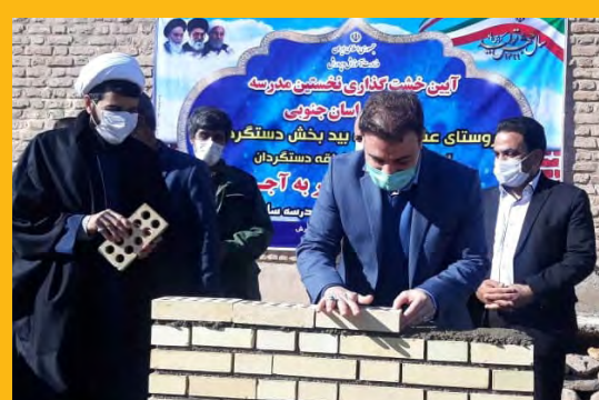
خشت گذاری اولین مدرسه خراسان جنوبی در طرح آجر به آجر صفحه ۸

۲۵۰۰ دانش آموز خراسان جنوبی بازمانده از آموختن در دوران کرونا