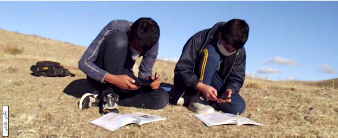
عکس از زمین