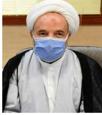
افزایش جان باختگان کرونا به ۷۱۷ نفر در استان

دادستان عمومی و انقلاب مرکز استان گفت: بررسی پرونده مشکل دار اراضی موسوف به موسوی یکی از اولویت های دادستانی است تا شاکیان به حق و حقوق خود برسند. حجت الاسلام نسائی زهان در گفتگو با باشگاه خبرنگاران جوان گفت: ۱۶ سال است که پرونده اراضی موسوی تشکیل شده است و مسئولان قضائی قبلی و استاندار پیشین هم کارهای خوبی