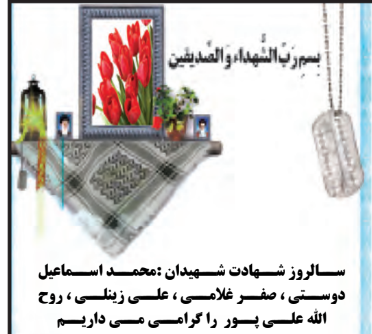
سالروز شهادت شهیدان: محمد اسماعیل دوستی، صفر غلامی، علی زینلی، روح الله علی پور را گرامی می داریم