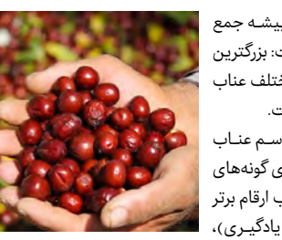
وجود ۳۴ اکتیپ عناب در بزرگترین کلکسیون عناب کشور در سریشه