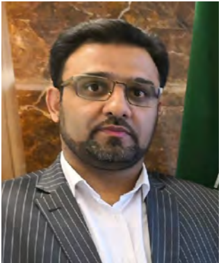
مشکل خط فعلی آب شهرک صنعتی باید هرچه زودتر بررسی و رفع شود.

تأکید بر بومی گزینی در کارخانه های شهرک صنعتی نهبندان افزود: نیروی کار شهرک صنعتی نهبندان باید در شهرستان پایش، آموزش و به کارگیری شوند. یکی در این جلسه با اشاره به تأمین برق مورد نیاز برخی از کارخانه های شهرک صنعتی تا پایان ماه جاری گفت: