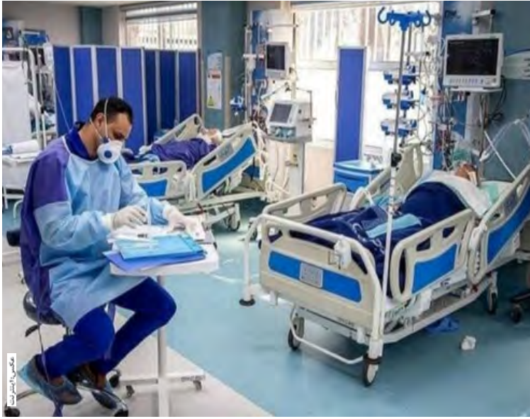
بهداشتی، برگزار نکردن دورهمی، عدم شرکت در اجتماعات و زدن ماسک برای پیشگیری و کنترل بیماری کرونا تاکید کرد.