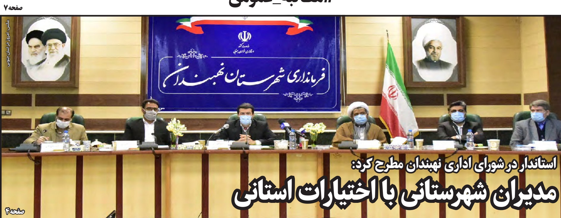
استاندار در شورای اداری نهبندان مطرح کرد: