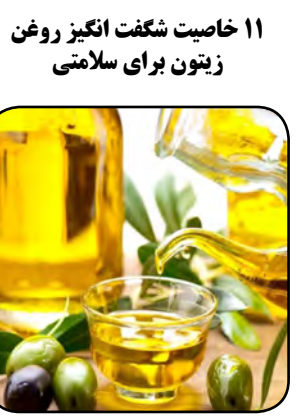
۱۱ خاصیت شگفت انگیز روغن زیتون برای سلامتی

چاقی ارتباط ندارد. مبارزه با آزالیمیر ۸. کاهش خطر ابتلا به دیابت نوع ۲ ۹. خواص ضد سرطانی ۱۰. کمک به بهبود آرتروز روماتوئید ۱۱. خواص ضد باکتری روغن زیتون حاوی مواد مغذی بسیاری است که می‌توانند باکتری‌های مضر را مهار کنند. یکی از این موارد هلیکوباکتر پیلوری است، باکتری که در معده زندگی می‌کند و می‌تواند باعث زخم سرطان معده شود. یک مطالعه روی انسان نشان داد مصرف روزانه ۳۰ گرم روغن زیتون، می‌تواند عفونت هلیکوباکتر پیلوری را در ۱۰ تا ۴۰٪ افراد در کمتر از دو هفته از بین ببرد.