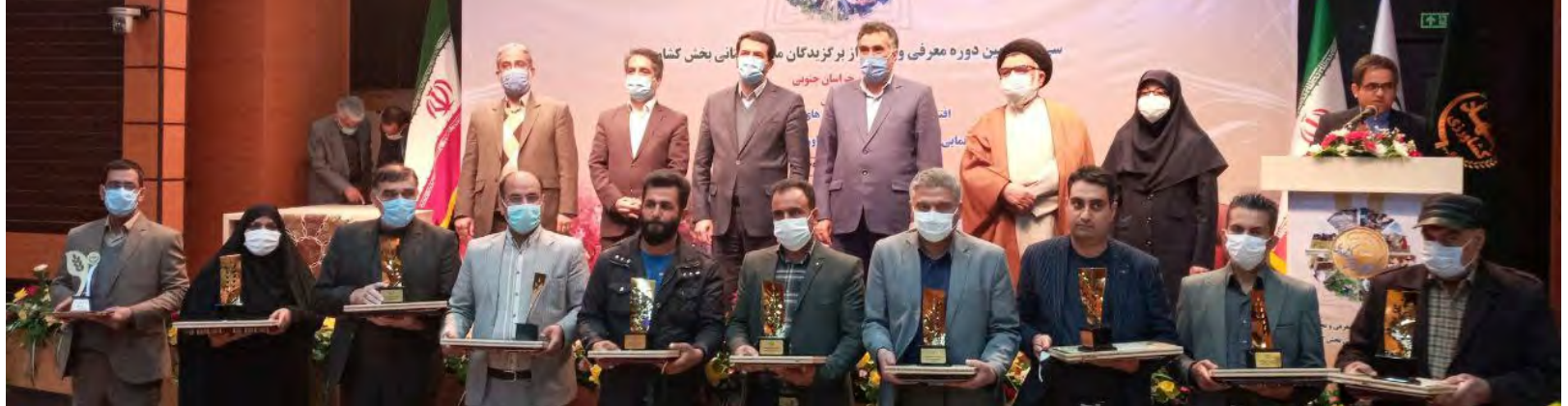
تجلیل از ۴۲ نفر تولید کننده برتر استان شامل ۳۳ نفر آقا

در ادامه از ۴۲ نفر تولید کننده برتر استان شامل ۳۳ نفر آقا