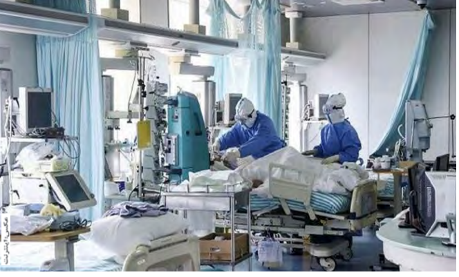
معاون بهداشتی دانشگاه علوم پزشکی بیرجند گفت: در حال حاضر ۱۲۶ بیمار با علائم تقصی در بیمارستان های خراسان جنوبی بستری هستند که ۳۷ نفر کرونا مثبت هستند.

بخش مراقبت های ویژه بستری هستند که حال عمومی ۳ نفر وخیم است. وی گفت: در روز گذشته ۲۷ بیمار با علائم تقصی در بیمارستان های استان پذیرش و در همین مدت ۱۹ بیمار شامل ۵ بیمار کرونا مثبت با حال عمومی خوب ترخیص شدند.