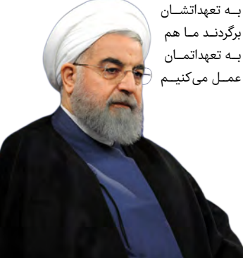
هر ساعتی به تعهداتشان برگردند ما هم به تعهداتمان عمل می کنیم

این دولت در سال ۹۵ درآمد ما ۶۵ میلیارد دلار بود. اما در این سالهای جنگ در این یک سال آخر فشارهای بی سابقه و مضاعف بر روی دوش مردم بزرگ ایران قرار داشت. در کنار تحریم سخت و جنگ اقتصادی، پارسال در همین ماه بهمن با یک پاندمی و ویروس عالمگیر مواجه شدیم و صادرات نفتی ما تقریباً متوقف شد چون مرزها بسته شد. صادرات غیرنفتی هم که کم بود. کمتر شد، اما مردم روی پای خود ایستادند. ما در چهار جبهه با فشار مواجه شدیم؛ تحریم، کرونا، فشار روانی و جنگ رسانه ای. امیدوارم پایان دولتیم با مهار کامل این ویروس باشد. دوران تحریم حداکثری تمام شد. دوران جنگ اقتصادی تمام شد. همه فهمیده اند فشار حداکثری شکست خورد. من در برابر ملت ایران به خاطر صبرشان در رنج سه ساله، مقاومتشان در برابر انواع توطئه ها و ذهن آگاهشان در برابر رسانه های مخرب بیگانه سر فرود می آورم. سه سال است می خواهند ترامپ را تطهیر و توطئه و جنایت او را به عنوان ناکارآمدی دولت نام ببرند ولی رسوا شدند. اگر در این هفت سال و نیم در اداره کشور آنچنان که شایسته ملت بزرگ ایران نبوده عمل کرده ایم، از مردم بزرگوار ایران در این ایام جشن ملی طلب غفو می کنم. رئیس جمهوری در سخنانی که روز سه شنبه در مراسم تبریک سفیران کشورها به رئیس جمهوری به مناسبت سالگرد پیروزی انقلاب اسلامی ایراد کرد نیز گفت: خوشحالم که در فرصت سالگرد انقلاب اسلامی باز هم برای من فرصتی فراهم شد تا با سفرای محترم کشورهای دوست در جمهوری اسلامی ایران سخن بگویم. برای ما ۲۲ بهمن روز بسیار مهم و تاریخی ساز