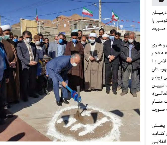
مدیر کل آموزش و پرورش خراسان جنوبی گفت: در دهمین روز ده مبارک فجر عملیات اجرایی احداث نمازخانه دبستان روستای کرغند شهرستان قاین آغاز شد و ۲ کلاس درس نیز در بشرویه به بهره برداری رسید.

نمازخانه روستای کرغند شهرستان قاین، تصریح کرد: این نمازخانه با زیربنای ۱۵۵ متر مربع احداث می شود و برای احداث آن مبلغ ۳۰۰ میلیون تومان مورد نیاز است که تمام این مبلغ از سوی خیر این روستا تأمین و هزینه می شود. وی با اشاره به برخورداری یکصد دانش آموز این دبستان از مزایای این طرح اظهار کرد: علاوه بر این، طرح توسعه ۲ کلاسه ی دبستان انقلاب اسلامی روستای غنی آباد شهرستان بشرویه نیز به بهره برداری رسید.