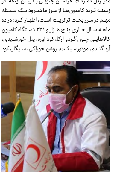
خیران ۱۰ دستگاه اکسیژن ساز در قالب کمپین «نفس هدیه کنیم» به بانک امانات تجهیزات پزشکی هلال احمر خراسان جنوبی اهدا کردند.