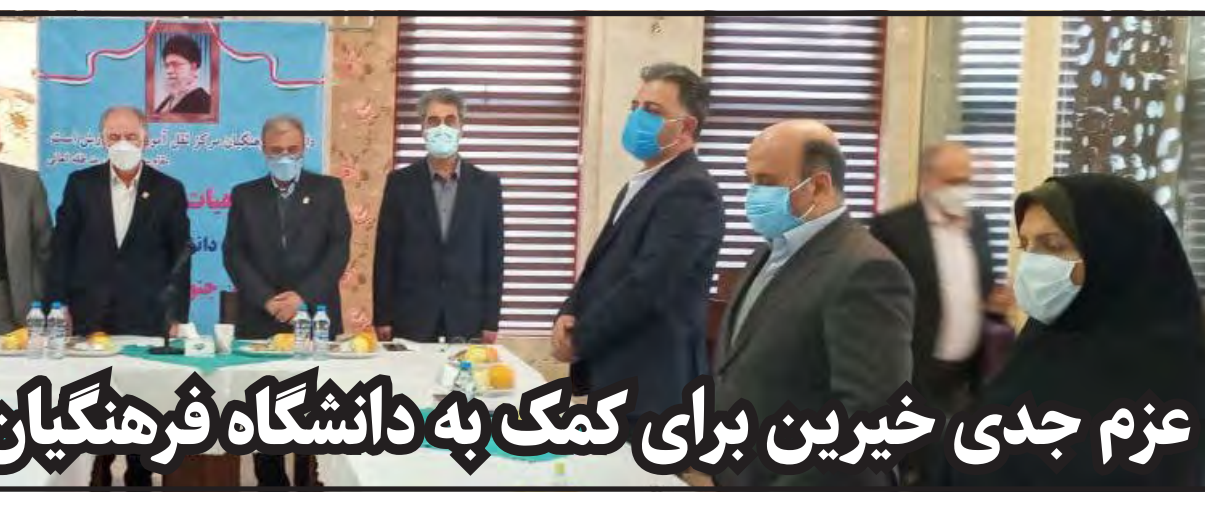
عزم جدی خیرین برای کمک به دانشگاه فرهنگیان