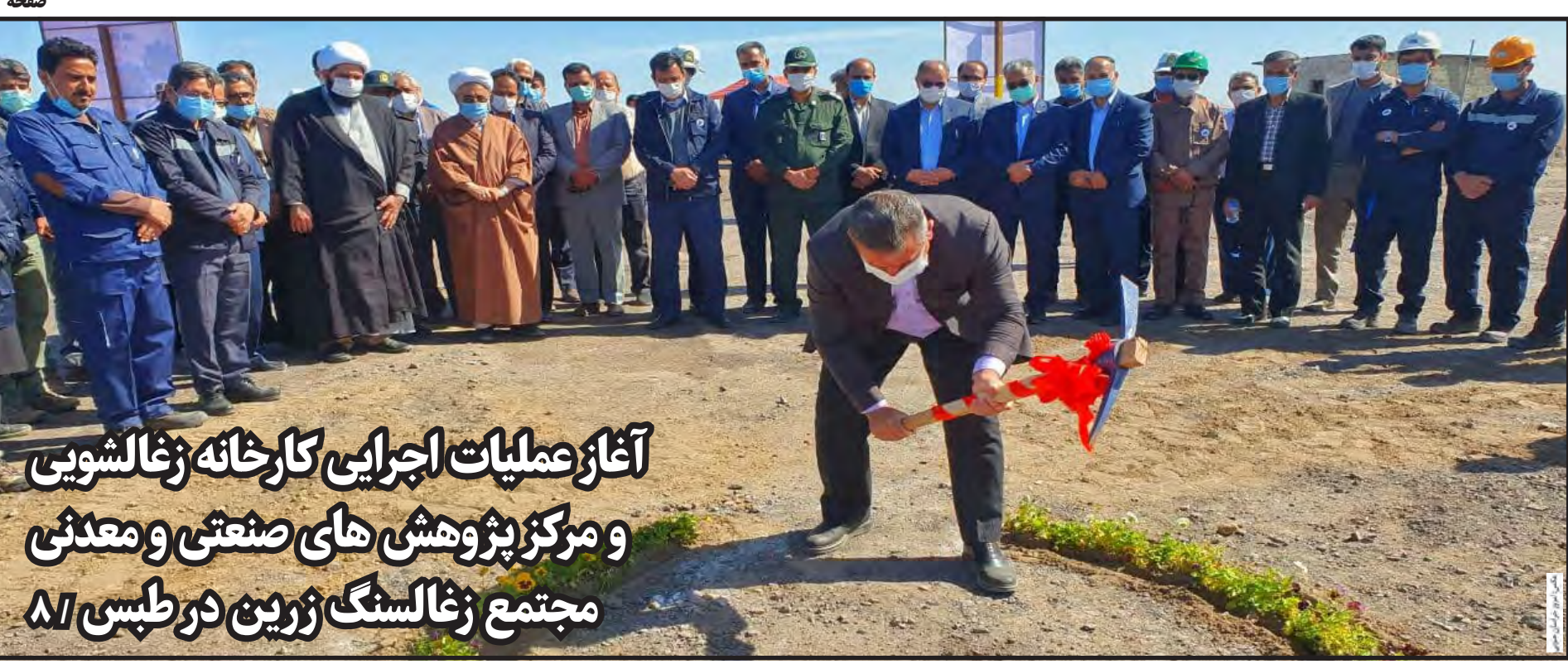
آغاز عملیات اجرایی کارخانه زغالشویی و مرکز پژوهش های صنعتی و معدنی مجتمع زغالسنگ زرین در طبس ۸/

کاهش رعایت پروتکل های بهداشتی از ۹۰٪ به ۷۰٪ در خراسان جنوبی