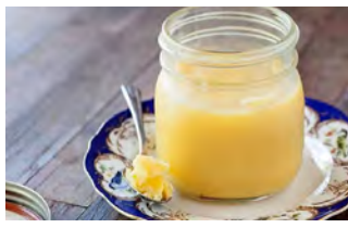
بروز پیدا می کنند. در بعضی موارد ممکن است علائم شدیدی مانند تنگی نفس و شوک آلرژیک ایجاد شود که ممکن است جان فرد را نیز تهدید کند. برای جلوگیری از این خطرات سلامتی، بیماران باید از خوردن ماهی و همچنین کپسول های حاوی روغن ماهی اجتناب کنند. از طرف دیگر، بیماران باید فقدان عناصری که ناشی از عدم مصرف ماهی است، چون ید، ویتامین دی و اسیدهای چرب امگا ۳ را جبران کنند. شیر و فرآورده های آن و تخم مرغ منابع غذایی غنی از ید هستند، در حالی که بدن می تواند غنی از طریق قرار گرفتن در معرض نور خورشید و همچنین با خوردن غذاهای غنی از ویتامین دی مانند تخم مرغ و شیر به تولید این ویتامین کمک کند. در مورد منابع غذایی غنی از اسیدهای چرب امگا ۳ نیز باید گفت که روغن های گیاهی مانند روغن بذر کتان و روغن سویا گزینه های خوبی هستند.