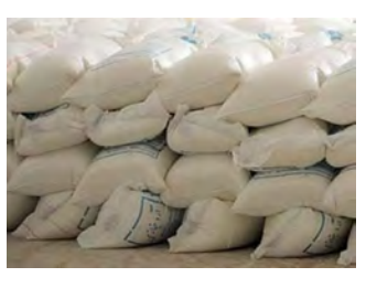
مأموران انتظامی پاسگاه مرک شهرستان بیرجند کشف ۴۴۰ میلیون ریال آرد قاچاق در شهرستان بیرجند

انجام تحقیقات تخصصی پلیسی انبار کالای احتکار شده را شناسایی و پس از هماهنگی با مقام قضائی در بازرسی از محل ۷۵ هزار قطعه انواع لوازم یدکی خودرو کشف کردند. سرپرست پلیس امنیت اقتصادی خراسان جنوبی با بیان این که کارشناسان ارزش ریالی کالای احتکار شده را ۵۱ میلیارد ریال برآورد کردند، گفت: مأموران در این رابطه یک متهم دستگیر کردند که متهم دستگیر شده به همراه پرونده به مراجع قضائی معرفی شد.