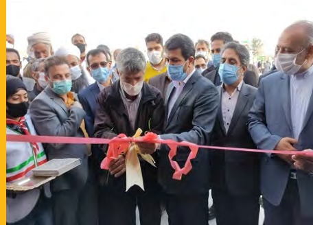
افتتاح دبستان ۶ کلاسه برکت در میان صفحه ۲

پیش بینی جمع آوری ۶ میلیارد تومان کمک در هفته نیکوکاری ۹۹ صفحه ۳