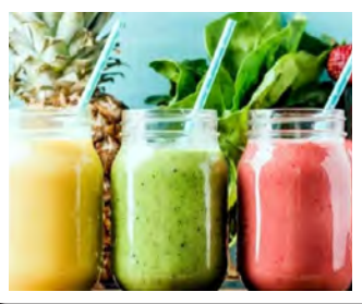
شمار می روید.

آهن به دلیل نقش مهمی که در تولید هموگلوبین خون و در نتیجه انتقال اکسیژن به سلول های بدن دارد، یک ماده معدنی مهم برای انسان به شمار می رود.