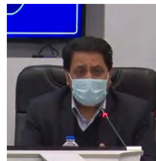
معاون حقوق بشر و امور بین الملل دادگستری و دبیر مرجع ملی کنوانسیون حقوق کودک گفت: آموزش و پرورش و مشاوران مدارس در موضوع آگاهی بخشی تهدیدات فضای مجازی وظیفه