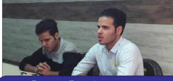
گفتگو با قهرمانان جهانی ورزش سه گانه / دوقلوهای آهنین و یک آرزو / ۷/