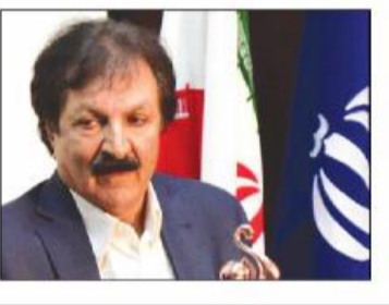
یک نویدکننده نام آشنای استان: مردم در خرید کالای ایرانی از خود شهامت به خرج دهند / ۸/