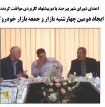
اعضای شورای شهر بیرجند با دو پیشنهاد کار بر دی موافقت کردند ایجاد دومین چهارشنبه بازار و جمعه بازار خودرو / ۳/