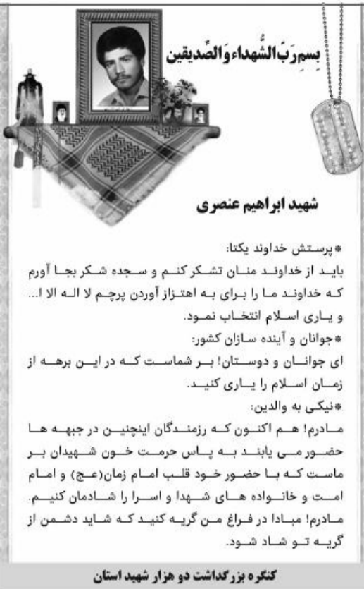
شهدای ابراهیم عصری کنگره بزرگداشت دو هزار شهید استان

تصویب دوباره ایجاد تشکیلات مدیریت پسماند از دیگر مصوبات کمیسیون بودجه طرح موضوع