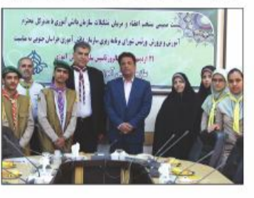
مدیر کل آموزش و پرورش استان عنوان کرد: ماموریت مهم مربیان سازمان دانش آموزی / ۲/