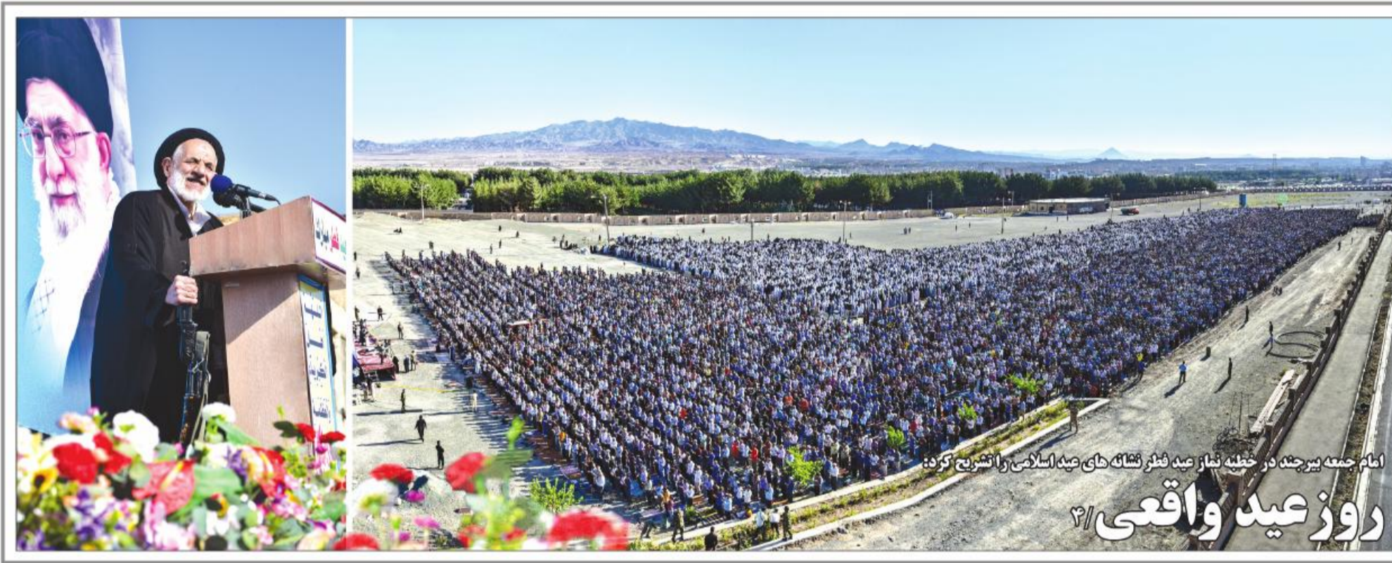
امام جمعه بیرجند در خطبه نماز عید فطر نشان های عید اسلامی را تشریح کردند روز عید واقعی ۲/