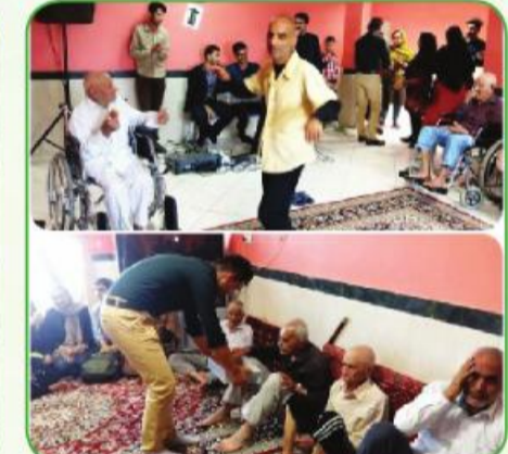
پویش مردمی نذرشادی در عید فطر