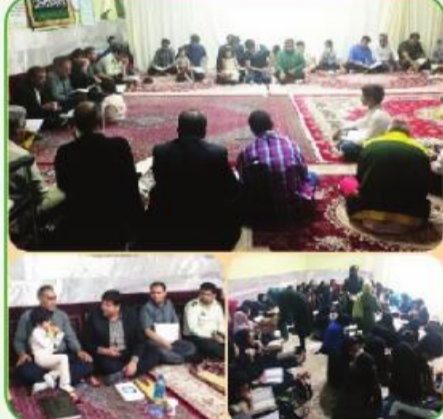
هیئت حسینی عاشقان اهل بیت(ع)