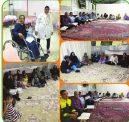
علی آبادی های مقیم بیرجند