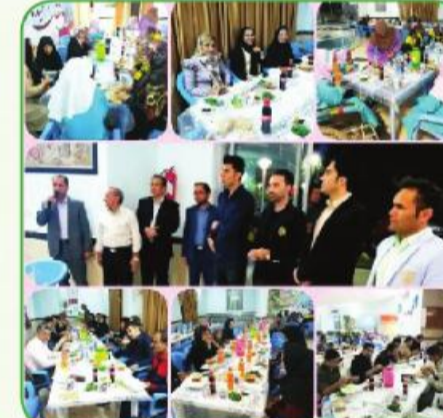
هنرمندان نیکوکار استان

به پایان آمد این دفتر حکایت همچنان باقیست .... ضمن عرض تبریک فرارسیدن عید سعید فطر و آرزوی قبولی طاعات و عبادات، مؤسسه خیریه (غیردولتی) توانبخشی حضرت علی اکبر(ع) با استقرار پایگاههای جمع آوری زکات و فطریه در میادین اصلی شهر و نیز پایگاه سیار به شماره ۰۹۱۵۳۶۳۶۳۱۴ همچنان آمادگی خود را جهت دریافت اعانات شما همشهریان نیک اندیش اعلام می دارد. شماره کارت کشاورزی «زکات کفاره» ۶۰۳۷۷۰۷۰۰۰۰۴۹۸۳۷ شماره کارت توسعه تعاون «زکات فطر به» ۵۰۲۹۰۸۱۰۱۶۵۲۸۰۹۹ شماره کارت پاسارگاد «کمک به موسسه» ۵۰۲۲۲۹۱۹۰۰۰۰۴۳۳۵۵ درگاه اینترنتی: www.tavanaliakbar.ir جهت هرگونه سؤال، پیشنهاد و انتقاد با ۳۲۲۰۲۰۰ تماس حاصل نمایید. آدرس: بیرجند - شهرک شهید مفتاح - خیابان شهید شهاب - مؤسسه خیریه توانبخشی حضرت علی اکبر(ع) روابط عمومی مؤسسه خیریه توانبخشی حضرت علی اکبر(ع)