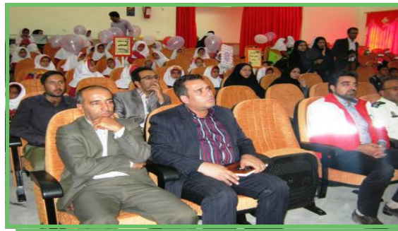
جشن روز کودک در شهرستان در میان