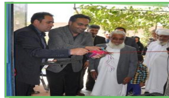
افتتاح روستا مهد مهر آذین نوغاب