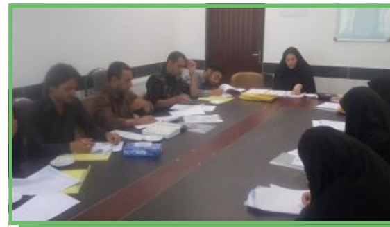
دوره آموزشی طرح نشاط اجتماعی ویژه دانشجویان تحت حمایت بهزیستی