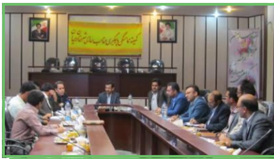
جلسه کمیته مناسب سازی شهرستان