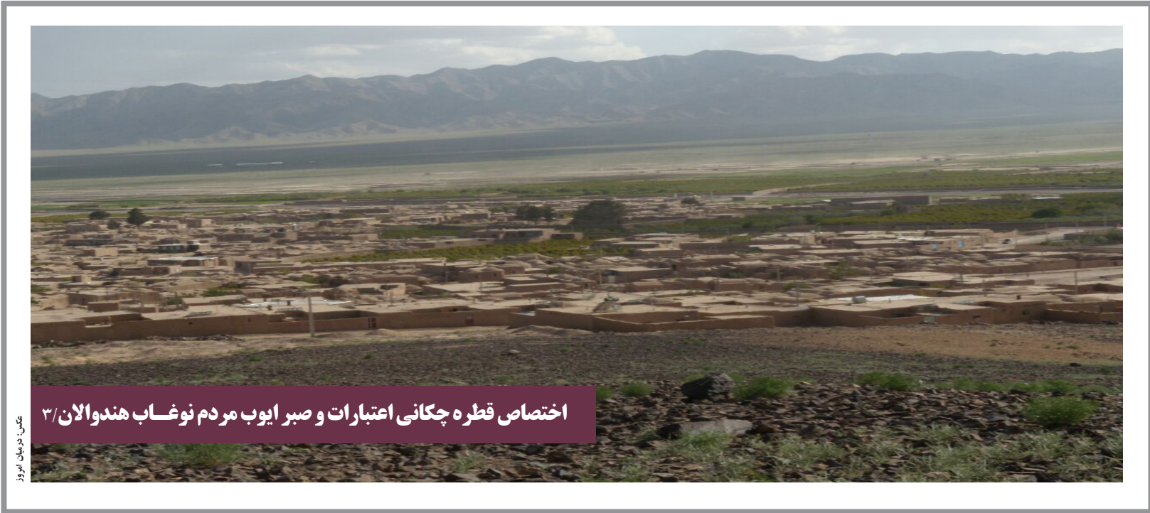
اختصاص قطره چکانی اعتبارات و صبر ایوب مردم نوغاب هندولان ۳/