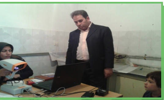
اجرای طرح غربالگری تنبلی چشم کودکان