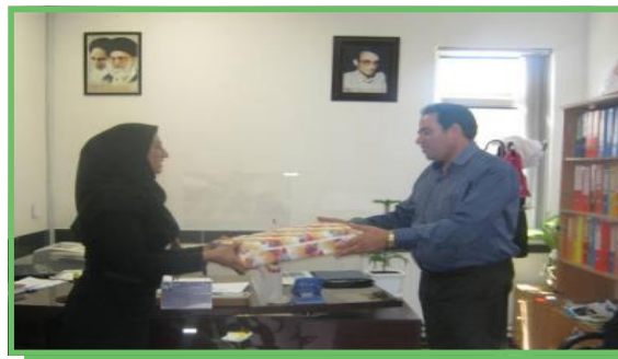
تقدیر از همکاران دختر به مناسبت میلاد حضرت معصومه (س)