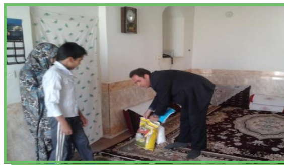
توزیع سبد غذایی به مناسبت هفته بهزیستی