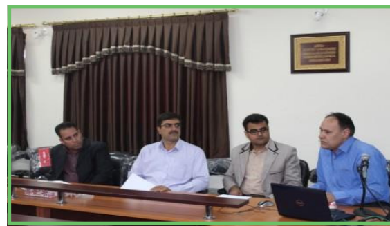
طرح آموزش مفاهیم بهداشت ویژه مهد کودک ها