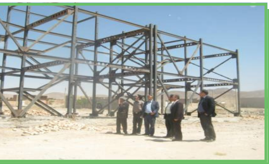
بازدید از پروژه ۸ واحدی مسکن معلولین در شهر قهستان