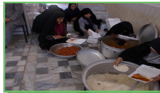
پخت افطاری توسط کلینیک خیر به وصال