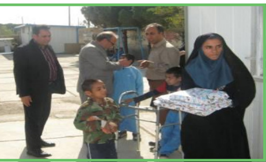
حضور در مدرسه استثنایی مهر آفرین به مناسبت روز جهانی نابینایان