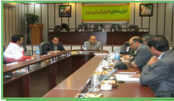
شورای ساماندهی امور سالمندان