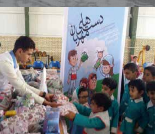
اجرا طرح دست های مهربان