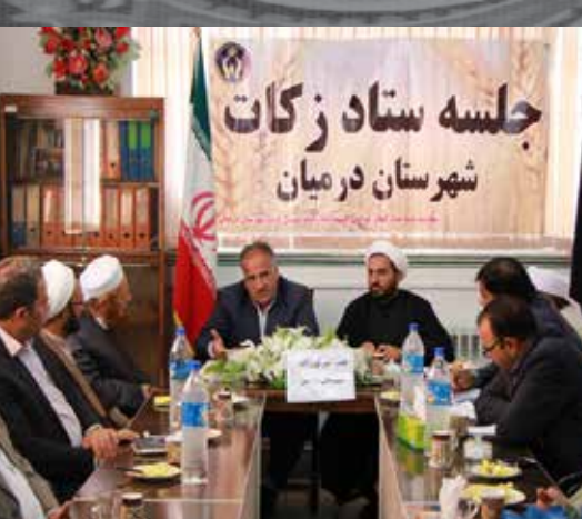
جلسه ستاد زکات شهرستان درمیان