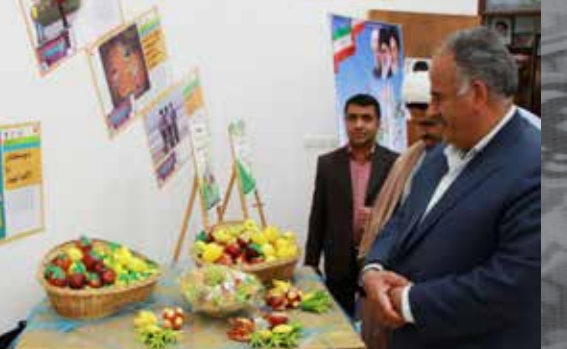
بازدید فرماندار از نمایشگاه سلامت و توانمندی های بانوان درمیان