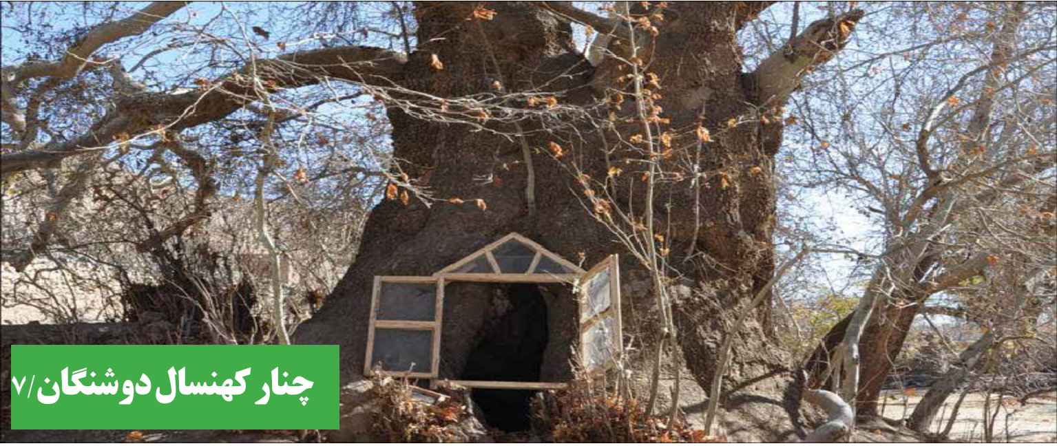
چنار کهنسال دوشنگان ۷/